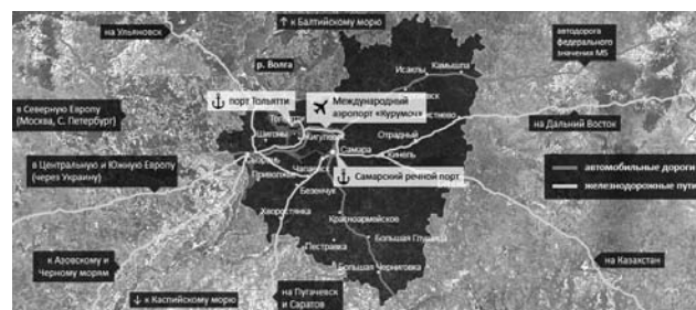
Рис.2. Национальные и международные транспортные коридоры Самарской области

В Самарской области воздушный транспорт осуществляет перевозки грузов и пассажиров как внутри области и внутри России, так и на международных авиалиниях. Обслуживание воздушного транспорта осуществляется аэропортами «Курумоч», «Смышляевка», «Безьянка», «Кряж», «Рождественно».