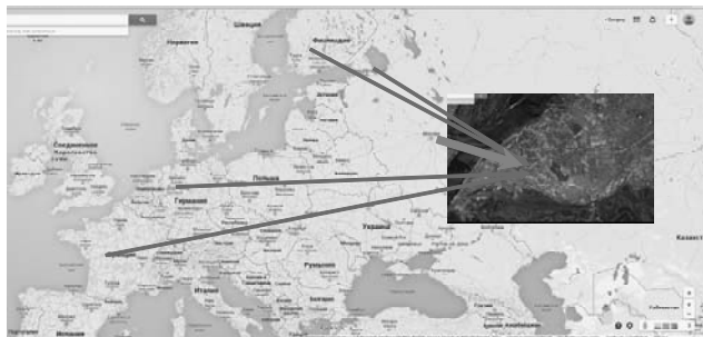
Рис. 3. Российская и интернациональная кооперация в сфере разработки гибкой и микроэлектроники для диагностики и лечения заболеваний

Основные партнеры: - Кардиологическая клиника г. Дюссельдорф; - Травматологическая клиника г. Ессен; - Горная школа Сент-Этьен; - Лаборатория VTT (Финляндия); - Стенфордский университет (США); - ЛЭТИ (Санкт-Петербургский электротехнический университет); - компания Элтех